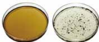
アグロリグ®SC 他のフミン酸製品 他の液体製剤との混合の様子